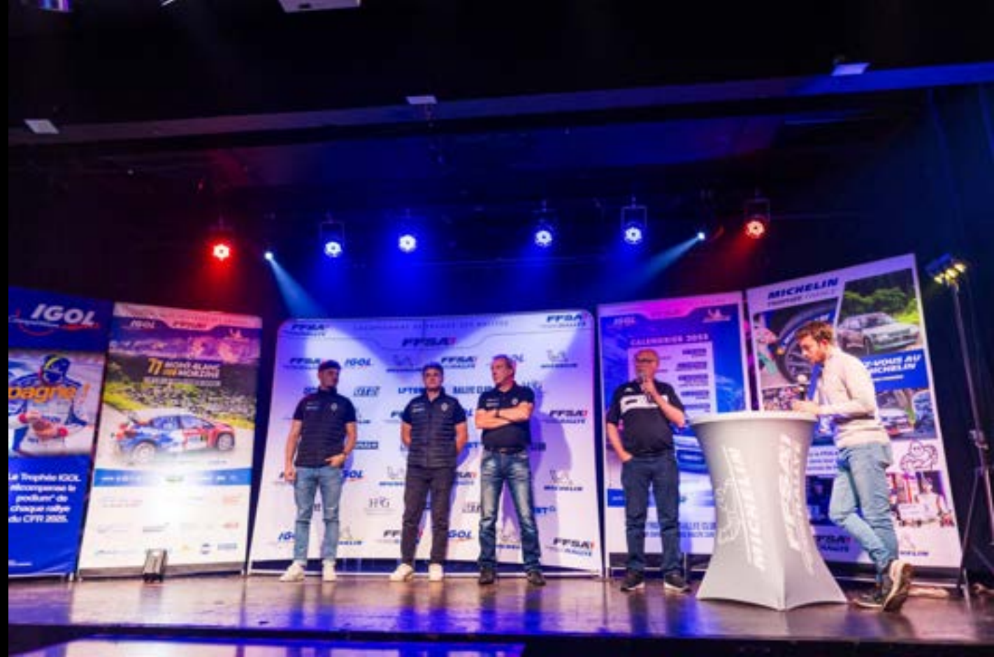
Championnat de France de Rallye